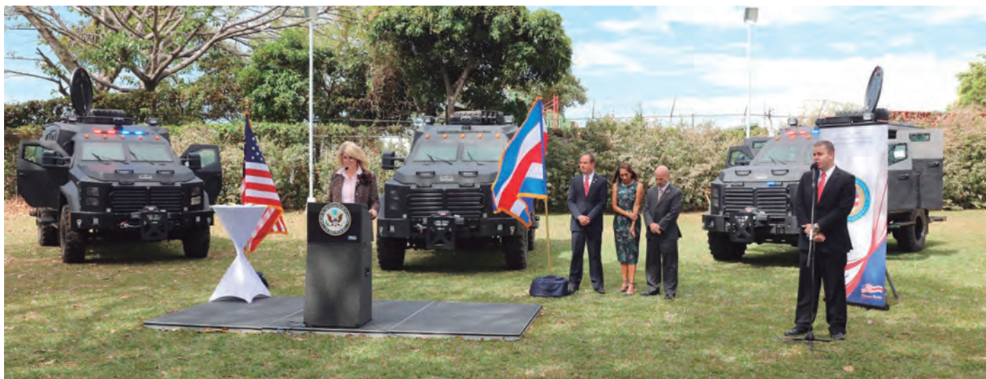
Acto de la entrega de los blindados Némesis a Costa Rica.

La DSE tiene su base en la creación de la Agencia de Seguridad Nacional el 1 de septiembre de 1963, bajo dependencia y dirección del Ministerio de Seguridad Pública. La Dirección de Inteligencia y Seguridad Nacional (DIS) se constituyó a través de la Ley General de Policía de 19 de mayo de 1994. Es un órgano encargado sólo de informar al Presidente de la República en temas de Seguridad Nacional. Posteriormente, el Gobierno emitió el Decreto Ejecutivo N° 23758-MP del 18 de noviembre de 1994, llamado Reglamento de Organización y Servicio de Dirección de Inteligencia y Seguridad Nacional. En 1986 se emitió el Decreto Ejecutivo 16398, el cual trasladó esta Dirección del Ministerio del Interior al de la Presidencia. Posteriormente, la Ley General de Policía, el 19 de mayo de 1994, y en 2005 el Reglamento de Organización y Funcionamiento de la Dirección de Inteligencia y Seguridad Nacional define a la DIS como un cuerpo policial que es un órgano informativo del Presidente de la República en materia de seguridad nacional.