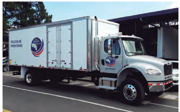
Camión de la Policía de Fronteras de Costa Rica donado por la Embajada de EEUU.

La renovada Policía de Fronteras se hizo operacional en marzo de 2011 en La Tablillas de Los Chiles, cerca de la frontera con Nicaragua. Con ello se desarrolló el Plan Estratégico de Fronteras, que preveía un eje preventivo y uno operativo. Se planteaba el establecimiento de direcciones regionales de Policía de Fronteras dentro de la Estructura Orgánica del Ministerio de Seguridad Pública, una correspondiente a la Región Chorrotega Norte, con los cantones de La Cruz, Los Chiles y Upala, y la otra correspondiente a la Frontera Caribe, con los cantones Sarapiquí, Talamanca y Pococí. Se pretendía controlar los 113 km. de cordón fronterizo entre Los Chiles, Cutris y Pocosol, así como el distrito central de Los Chiles, en la frontera Norte, con 45 puestos de control. La Policía de Fronteras actualmente se conforma con el Departamento de Inteligencia Fronteriza, con las secciones de Análisis y Tratamiento de Información y de Contra-Inteligencia; y el Departamento Operativo, con las secciones de Planificación Estratégica y la de Seguridad Tecnológica y Comunicaciones.