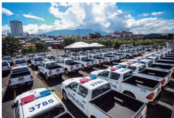
Entrega de patrullas a la Policía de Costa Rica.