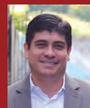
Presidente Carlos Alvarado Quesada

Operan 3 Libertador de 110 pies, 1 Swiftships de 105 pies, 3 guardacostas de 82 y 1 de 65; se espera la recepción de 1 Defiant-85. Se han adquirido 4 Eduardoño Patrullero 450 y no menos de 12 Eduardoño 380 y 320. La flotilla naval suma 77 embarcaciones menores, incluyendo 10 Patrullero-195 (operando con la Guardia Costera en Tortuguero), lanchas Tracker Grizzly 1860 MVX; y 2 de 33 pies del tipo SAFE Defender.